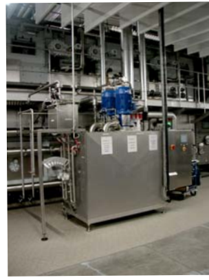
SET Membran-Laugenfiltration LF-4

Auf dem Versuchsweg die anlagen-spezifischen Daten ermitteln dann System-Optimierung